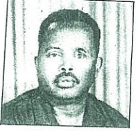
بقلم : يوسف الحاج عبدالرحمن

السادة أسرة تحرير أخبار العالم الإسلامي السلام عليكم ورحمة الله وبركاته .. وبعد : أرجو أن تمنحونا الفرصة لإعطاء القارئ الكريم لمحة عن تاريخ مملكة هرة الإسلامية وما تواجهه من اضطهاد من النظام الأثويبي الحاكم .. جغرافية هرة : تقع هرة في المنطقة الداخلية من القرن الأفريقي وبجهدا جمهورية الصومال من الشرق ، والحيشة من الغرب ، وكينيا من الجنوب وجمهورية جيبوتي من الشمال الشرقي . ولقد احتلها الأحياش في نهاية القرن التاسع عشر بعد تقسيم الصومال إلى خمسة أجزاء وصارت جيبوتي من نصيب فرنسا . في عام ١٨٨٥ م صار الإقليم الشمالي ( هرجيسا ) ووجج ( التي هي الآن خاضعة لكينيا ) من نصيب بريطانيا ، والإقليم الجنوب ( مقديشو ) من نصيب إيطاليا . وفي عام ١٨٨٧ م الموافق لعام ١٣٠٤ هـ صار إقليم الصومال الغربي ( هرة ) من نصيب المملكة المتحدة . المساحة : مساحة الصومال الغربي ٦٥٠٠٠٠ كيلو متر مربع . عدد السكان : ما يربو على عشرة ملايين نسمة . مدينة هرة : وهي حاضرة مملكة ( هرة الإسلامية ) ويرجع عهدها إلى العصور القديمة . وينسب نشأتها إلى القبائل العربية الذين هاجروا من الجزيرة العربية عامة ومن اليمن ، الجنوب العربي ، خاصة أيام نشوب الحروب الدموية بين الأمويين والعباسيين . وفي الألف الأول قبل الميلاد ، أصبحت مدينة هرة عاصمة صيفية لمملكة سبا اليمنية . وكان قصر الملكة بلقيس مشيد داخل مدينة هرة القديمة المسورة . الدين : كان أهل تلك المنطقة يدينون بالوثنية في أول عهدهم وكانوا يجيدون الأصنام . وكان صنمهم المشهور يسمى ( نسرا ) وكان في تلك