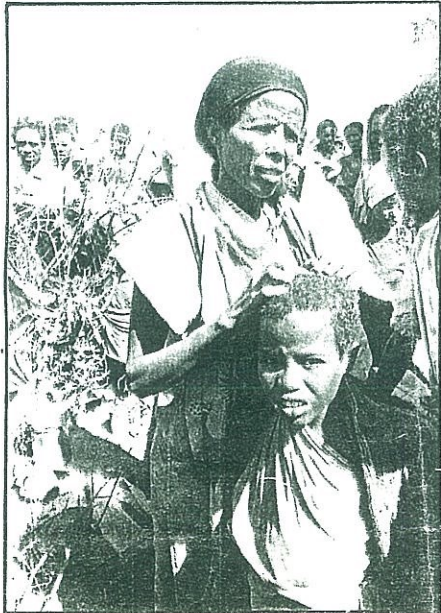
الشعب الهرري - التي ماتي ثبلي نظرة التشرد والحالة تطوره ١٢

الاسلامية وبدأ التدريس باللغة العربية في جميع المدارس التي أنشأها المسلمون واستعملت اللغة العربية رسميا في المراسلات في مقاطعات هرر وجيبا التي كان لها مركز عظيم بعد هرر من مراكز المسلمين التي أنشأها الايطاليون ، كما وأنشئت كلية دار العلوم الاسلامية للتخصص في الفقه في جيبا . وفي ذلك العهد بدأ المسلمون في تنشيط التجارة وتقييم الزراعة . لقد كانت هرر قبل احتلال الحبشة لها مركزا تجاريا كبيرا في شرق افريقيا ، ولقد ذكر المؤرخ شكيب أرسلان أمير البيان في أبان الاحتلال الايطالي للحبشة ومستعمراتها ندد ببعض الصحف العربية والغربية لتباكيها على احتلال ايطاليا للحبشة ، حيث قال (الا تنكرتم مملكة هرر العربية الاسلامية التي أغار عليها منليك ملك الحبشة بمساعدة الدول الصليبية الاستعمارية ونسف استقلالها واستحلبها ونزع أهاليها ، كما نزع الأت المسلمين في شوارع هرر يوم ١٧ فبراير ١٨٨٧ ، وقام بحرق الكتب الاسلامية القيمة كما فعل المغول عند دخولهم لبخاد ، وقام بتحويل الجامع الكبير في مدينة هرر إلى كنيسة ومنع استعمال اللغة العربية في هرر التي كانت من أعظم كرامتي الاسلام والعربية في شرق افريقيا !!! بعد انهزام ايطاليا امام الحلفاء وعودة الطاغية هيلاسلامي إلى الحكم أخذ يعمل في هدره ومكر وخيث في إعادة المسلمين إلى ماكانوا عليه من حرمان وأهمل وظلم في عهد سلفه منليك ، كما قام بارخاء ستار التنسيان عليهم عن العالم الخارجي حتى